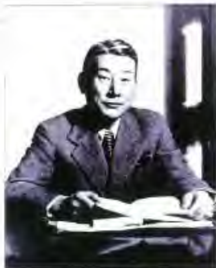
外交官時代の杉原千畝