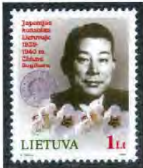
リトアニアの切手