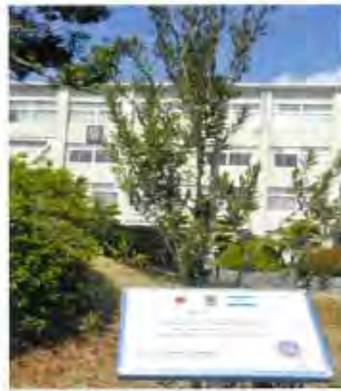
瑞陵高校の校庭にあるオリーブの木