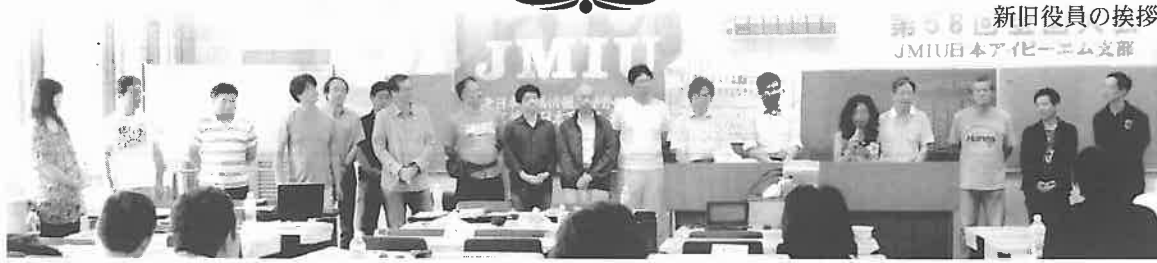
新旧役員の挨拶 JMIU日本アイビーエム支部