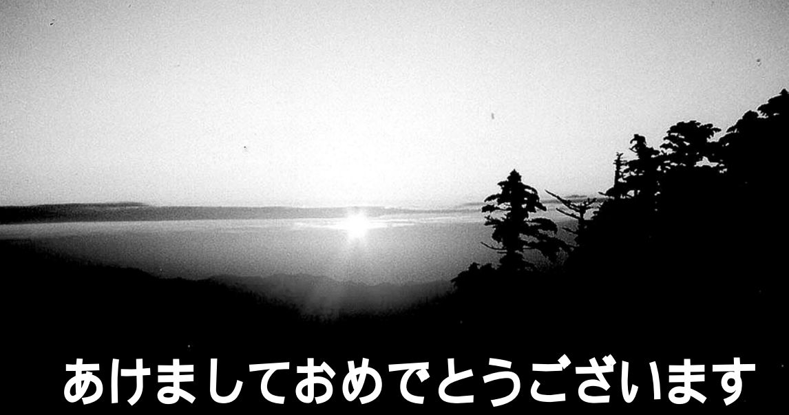
大峰山脈・弥山(ミセン)から望む日の出